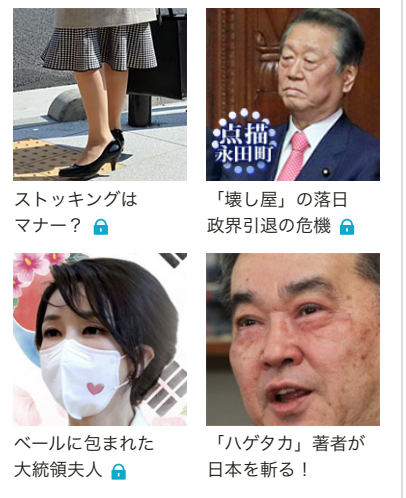
ストッキングはマナー？

一般社団法人AIM医学研究所 (The Institute for AIM Medicine, 略称IAM) は、AIMに関する研究を総合的かつ集中的に推進し、その成果の実用化を加速するために、AIMの発見者である宮崎博士を中心に設立された研究機関です。IAMにおける研究活動を通じ、AIMの働きの本来的なメカニズムである「体内から出るゴミの除去機構による新しい疾患